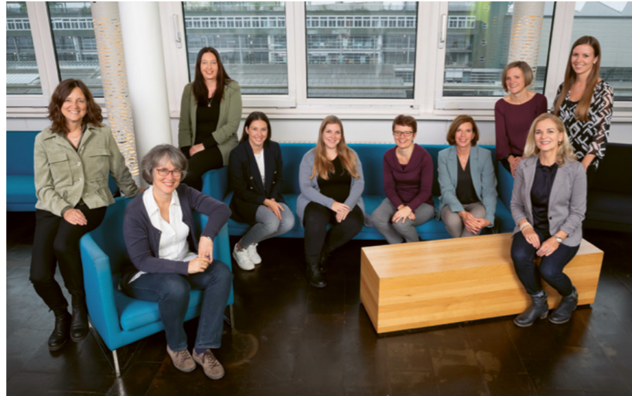
Team der Programmorganisatorinnen

Das Institut für Betriebs- und Regionalökonomie IBR ist eines von vier Instituten der Hochschule Luzern – Wirtschaft. Es wurde 1979 gegründet und ist damit das älteste Fachhochschul-Wirtschaftsinstitut der Schweiz. Das IBR ist ein verlässlicher Wissens- und Bildungspartner. Dies unter anderem auch durch den Einsatz unserer engagierten Programmorganisatorinnen. Die kompetente und persönliche Betreuung der Teilnehmenden ist für uns zentral und garantiert Ihnen eine verlässliche Unterstützung in allen organisatorischen und administrativen Fragen vor und während Ihrer Weiterbildung am IBR.