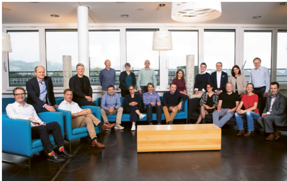
Team der Programmleitenden am IBR

Über 60 Weiterbildungsangebote bieten Ihnen Bildungschancen mit hohem Praxisnutzen. Als Teilnehmende gestalten Sie Ihre Weiterbildung aktiv mit und werden durch die jeweiligen Leitenden der Weiterbildungsprogramme und die Dozierenden auf Augenhöhe gefordert und gefördert. So bringen wir Menschen, Organisationen und Regionen weiter – mit Begeisterung und Engagement. Nutzen auch Sie unsere Weiterbildungskompetenz.