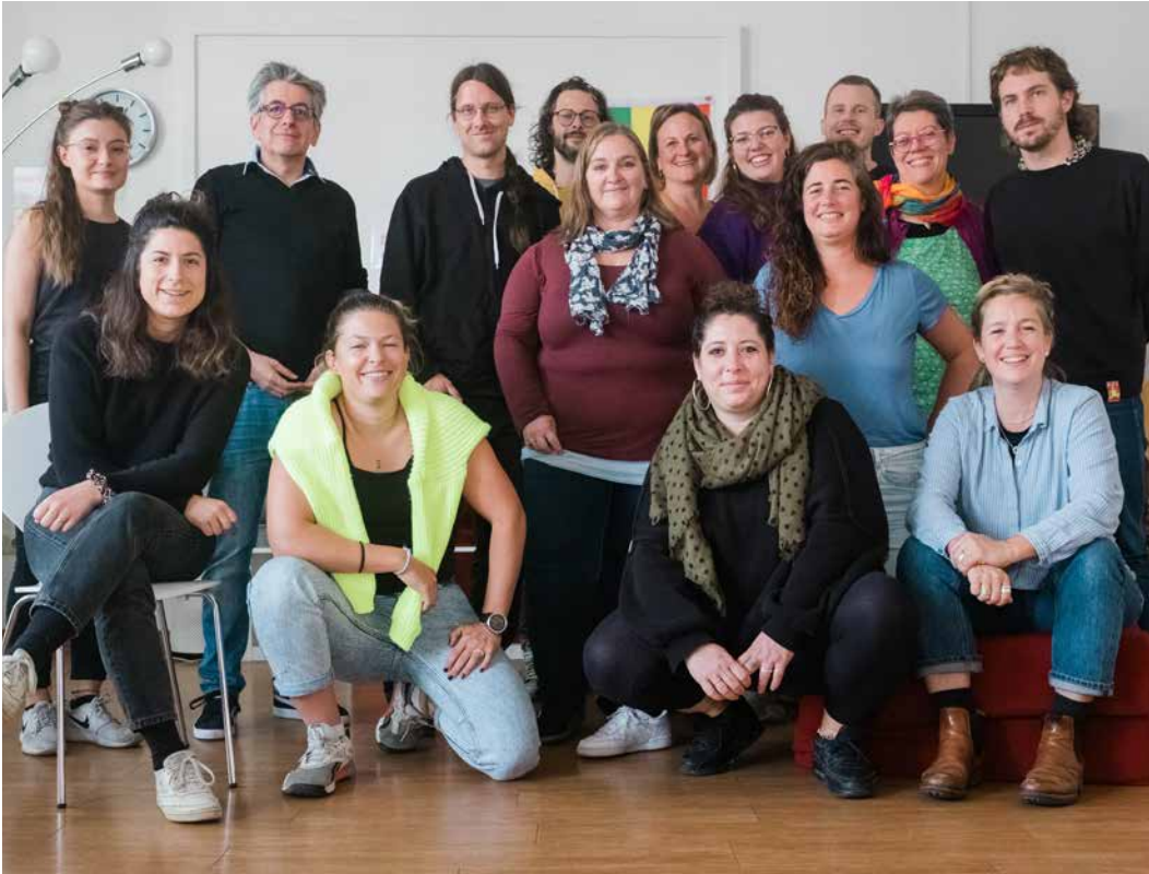
↑ Studienreise nach Berlin 2022 im CAS Sexuelle Gesundheit und Menschenrechte