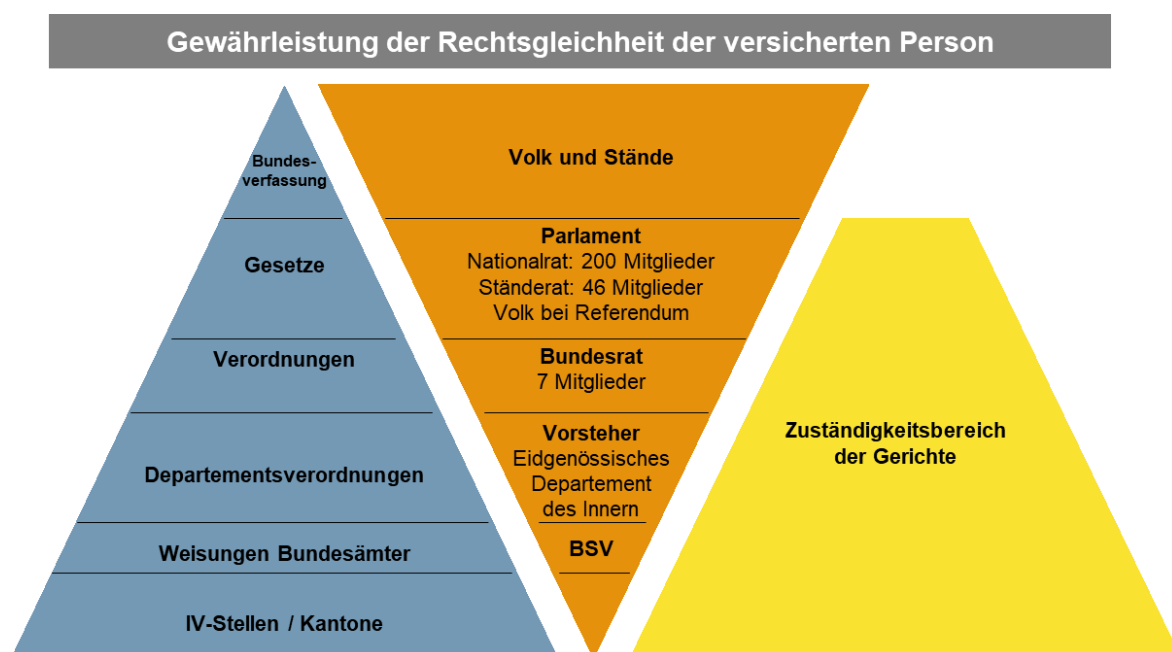
Abbildung 1: Normenhierarchie / Stufenbau des Rechts - Invalidenversicherung